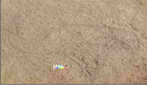
ಬುದ್ಧನ ಜೆಡ್ಡು ನವಿಲು

ನೂತನ ಶಿಲಾಯುಗದ ನಂತರ ಕಂಡು ಬರುವ ಸಂಸಕ್ತಿಯನ್ನು ತಾಮ್ರ ಶಿಲಾಯುಗವೆಂದು ಕರೆಯಲಾಗುತ್ತದೆ. ತುಳುನಾಡಿನಲ್ಲಿ ಈ ಸಂಸ್ಕೃತಿಯ ನಿಶ್ಚಿತ ನಿವೇಶನಗಳು ಕಂಡು ಬರುವುದಿಲ್ಲ. ಆದರೆ, ಬುದ್ಧನಜೆಡ್ಡು ಮತ್ತು ಗಾವಳಿಯ