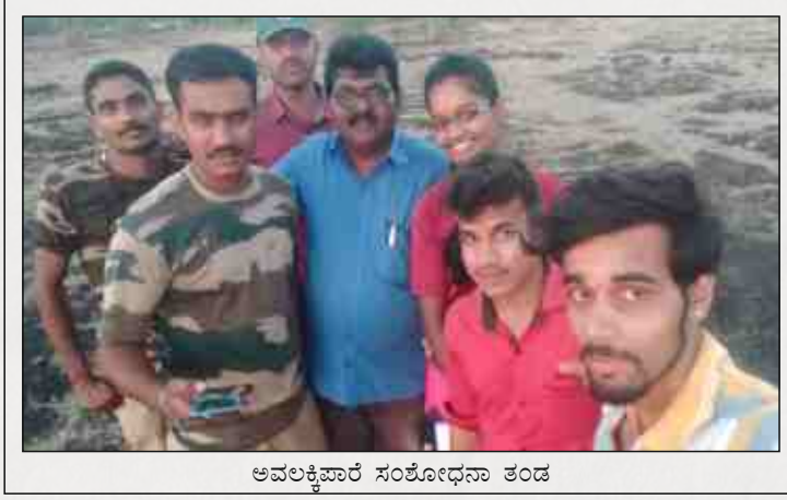
ಅವಲಕ್ಕಿಪಾರೆ ಸಂಶೋಧನಾ ತಂಡ

ಆಯುಧಗಳನ್ನು ತಯಾರಿಸಿದ. ಆದ್ದರಿಂದಲೇ ಈ ಯುಗವನ್ನು ಸೂಕ್ಷ್ಮ ಶಿಲಾಯುಗವೆಂದು ಕರೆಯಲಾಗಿದೆ. ತುಳುನಾಡಿನ ಸೂಕ್ಷ್ಮ ಶಿಲಾಯುಗದ ಮಾನವ ಸ್ಥಳೀಯವಾಗಿ ಲಭ್ಯವಿದ್ದ, ಕಲ್ಲುಗಳಿಂದ ಉದ್ಧನೆಯ ನೀಳ ಬ್ಲೇಡುಗಳು, ಅರ್ಧಚಂದ್ರಾಕೃತಿಯ