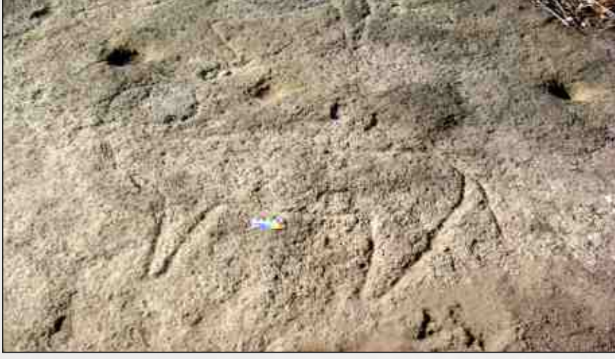
ಬುದ್ಧನ ಜೆಡ್ಡು ನವಿಲು

ಕೃಷಿ ಮತ್ತು ಪಶುಪಾಲನೆ ನೂತನ ಶಿಲಾಯುಗದ ಎರಡು ಮೂಲಭೂತ ಅಂಶಗಳು. ಬುದ್ಧನಜೆಡ್ಡುವಿನ ಬಯಲು ಬಂಡೆ ಆದಿಮ ಚಿತ್ರಗಳಲ್ಲಿ ಚಿತ್ರವಾಗಿರುವ ದನ ಮತ್ತು ಕರುವಿನ ಚಿತ್ರಗಳು ನಿಶ್ಚಿತವಾಗಿಯೂ ತುಳುನಾಡಿನ ನೂತನ ಶಿಲಾಯುಗದ