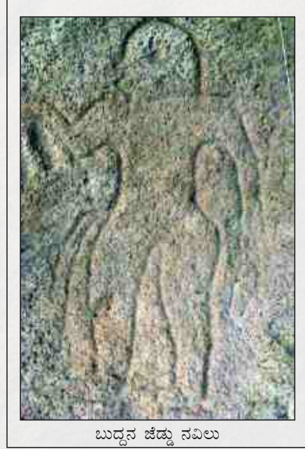
ಬುದ್ಧನ ಜೆಡ್ಡು ನವಿಲು